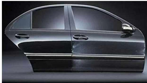
Рис. 2. Внешний вид нанопокрывтия (слева) и традиционного лакокрасочного покрытия (справа) после 5 лет испытания

Специалисты компании Ford's Research and Innovation Center разрабатывают ряд нанокompозитных материалов с целью получения покрытий с повышенными прочностью и износостойкостью.