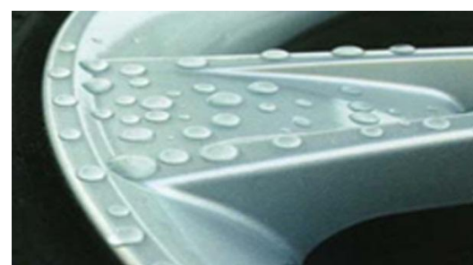
Рис. 4. Самоочищающиеся автомобильные нанопокрывтия:

а – на автомобильном лаке; б – на автомобильном стекле;