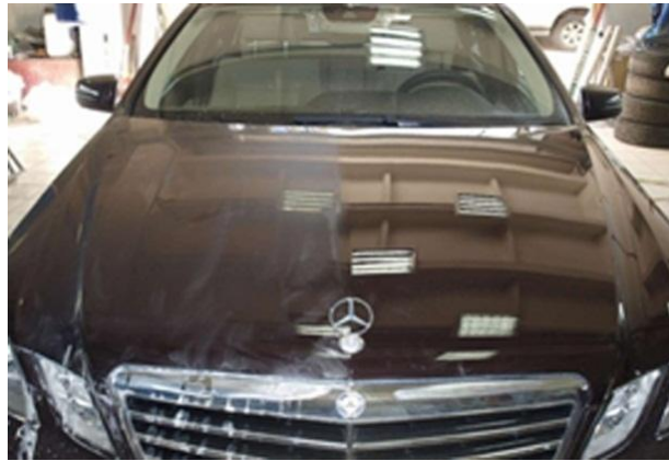
Рис. 1. Результаты испытаний автомобильных лакокрасочных покрытий (слева – традиционное покрытие; справа – нанопокрывтие)