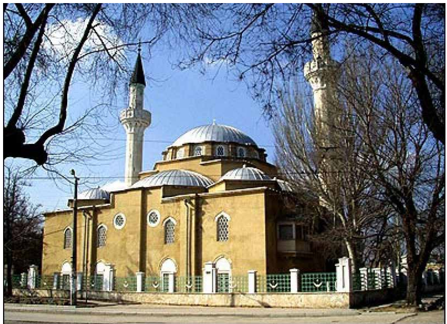
Фото 4. Мечеть Джума-Джамі в Євпаторії

А.: Багато. Ми реставрували і мечеть Джума-Джамі в Євпаторії (фото 4), і кенаси, і турецькі бані. Відреставровано і Лівадійський палац, і фортецю у Судаку. Мечеть хана Узбека у Старому Криму (фото 5) – це теж наша робота.