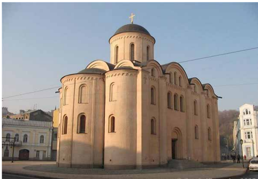
Фото 3. Церква Богородиці Пирогощої на Подолі, м. Київ

А негативний приклад Багато критикували за те відтворення Золотих Воріт, яке є зараз. Дуже багато я чув критики від колег за кордоном, мовляв це дуже неправильно було реставрувати таким чином пам'ятку археології. Ніхто не знав, що там було зверху, чи була чи не була церква, ніхто не фотографував, не малював. Були аналоги якісь. І відтворювали це все по аналогам, тому що хотіли в центрі мати таке.