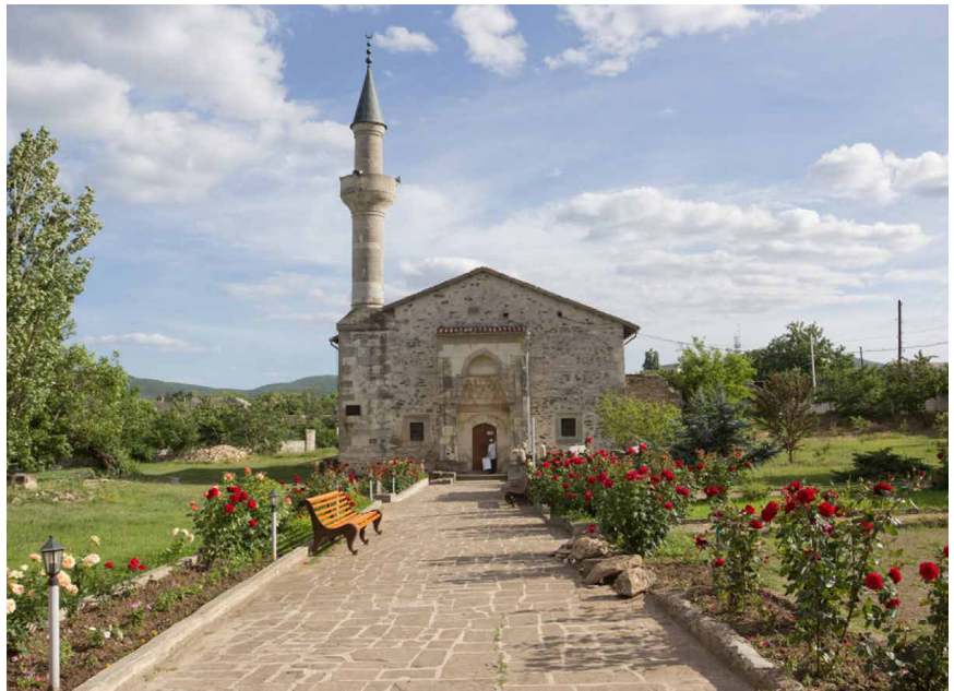
Фото 5. Мечеть хана Узбека у Старому Криму

Т. В.: Який останній був великий проект?