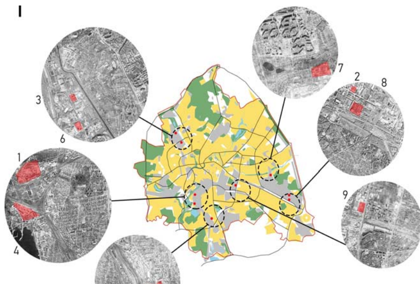
Рис. 1 Ситуаційна схема розміщення заводів будіндустрії в місті Харкові

Нами проведено окреме дослідження по балансу територій навколо заводів по виробництву ЗЗБ у м. Харкові. На рис. 2 наведено схему прилеглої території до заводу ЗБК № 5 за адресою: м. Харків, пр. 50-річчя СРСР, 171. Зроблено розрахунки площ сельбищних територій з будинками різної поверховості, промислових підприємств різних галузей та громадських будівель і закладів. Встановлено, що щільність розміщення робочих місць на згаданих територіях