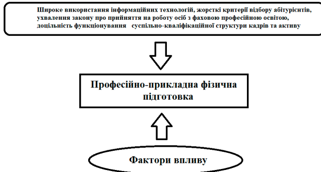
Рис. 1. Структурно-логічна схема вдосконалення професійно-прикладної фізичної підготовки: розроблено авторами на основі [4]

інформаційних технологій; жорсткі критерії відбору абітурієнтів; ухвалення закону, що закріплює прийняття на роботу осіб з фаховою професійною освітою; доцільність функціонування суспільно-кваліфікаційної структури кадрів та активу (рис. 1).