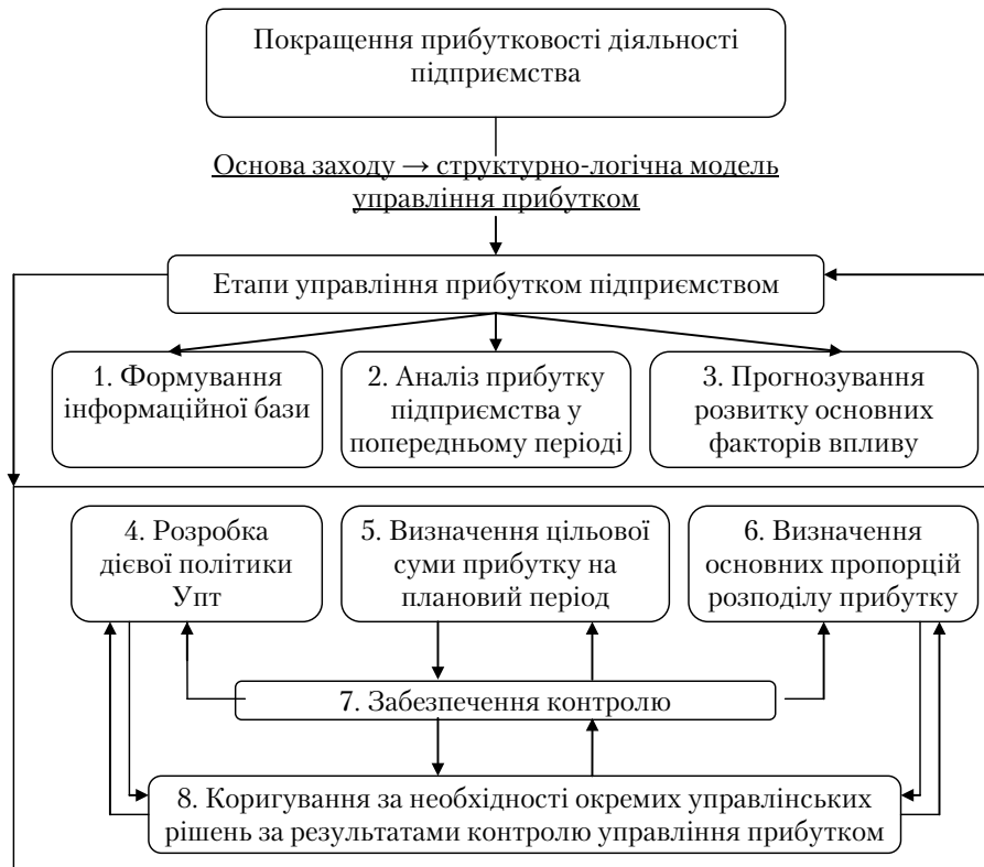
Рис. 2. Рекомендована структурно-логічна схема управління прибутком з позиції підвищення рівня прибутковості підприємства (складено авторами)

Процесу планування прибутку керівництво багатьох промислових підприємств не надає достатньої уваги. Процес планування прибутку – це розробка системи заходів щодо забезпечення її формування прибутку в необхідному обсязі й ефективне його