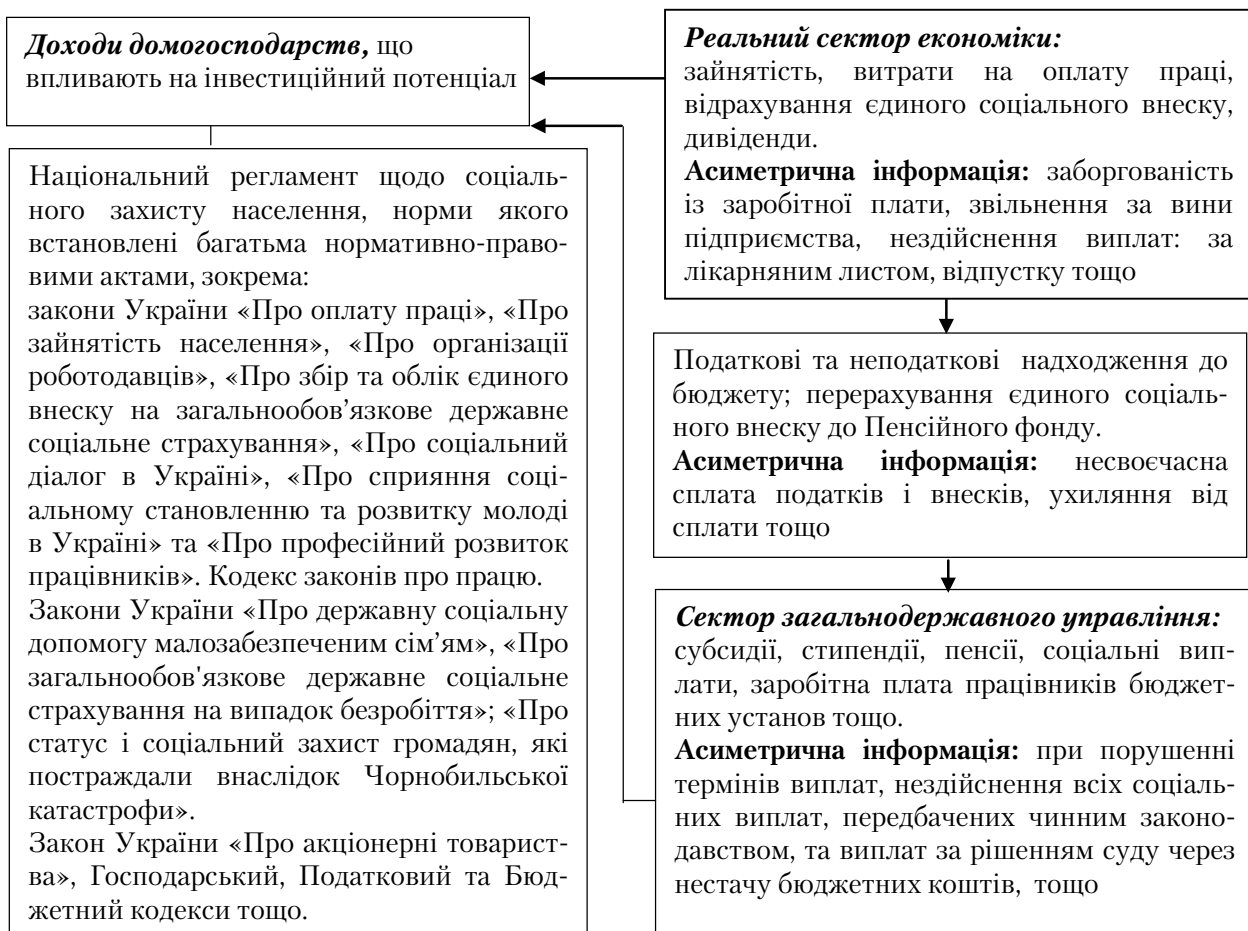
Рис. 1. Асиметрична інформація від міжсекторальної взаємодії домогосподарств та реального сектору й сектору загальнодержавного управління

Асиметричність інформації у міжсекторальних відносинах має місце навіть при існуванні основоположних законодавчих актів. Зокрема, Закон України «Про оплату праці» визначає економічні, правові та організаційні засади оплати праці працівників, які перебувають у трудових відносинах на підставі трудового договору з підприємствами, установами, організаціями усіх форм власності та господарювання, а також з окремими громадянами та сферою державного і договірного регулювання оплати праці, і спрямова-