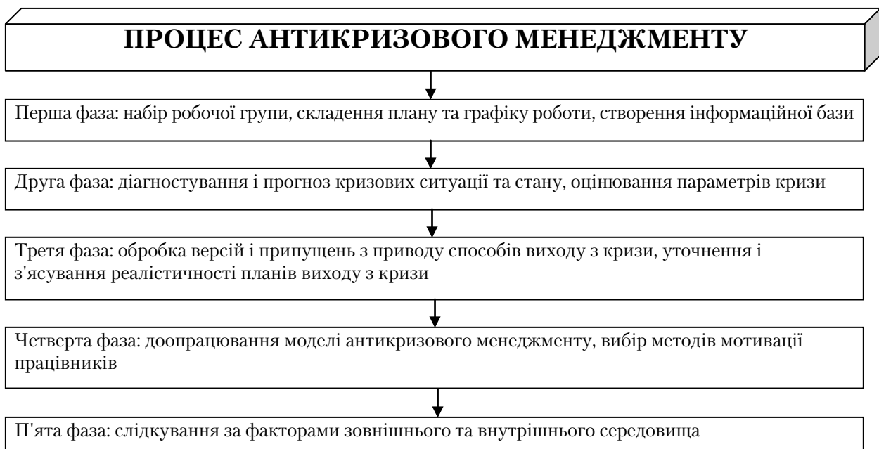
Рис. 2. Фази процесу антикризового менеджменту [3]

Процеси антикризового менеджменту мають здійснюватися на засадах цілеспрямованості, актуальності прийнятих рішень, їхньої адаптованості до етапу життєвого циклу підприємства. Головною метою антикризового менеджменту є погодженість та координування дій всіх підрозділів підприємства, забезпеченні можливостей для їхньої ефективної роботи. Окрім цього, при здійсненні антикризового менеджменту необхідно брати до уваги фазу, на якій знаходиться розвиток теорії та практики управління, механізм запобігання та виходу з кризових ситуацій [3]. З огляду на це, процес антикризового менеджменту, можна схематично зобразити на рис. 2.