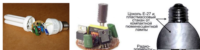
Рис. 3. Электронный балласт и корпус, в котором он размещен

Электронный балласт на печатной плате располагается в корпусе цоколя самой лампы (рис. 3) [4].