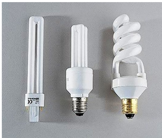
Рис. 1. Компактные люминесцентные лампы низкого давления

Наиболее широко распространенные типы люминесцентных ламп представлены на рис. 1 [4].