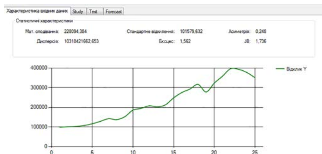
Рисунок 2. Результати попереднього аналізу вихідного ряду цільової змінної

Формат виведення результатів попереднього аналізу показано на рис. 2