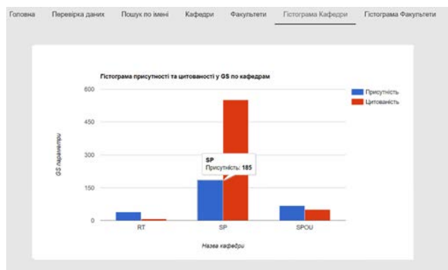
Рис. 4. Приклад гістограми для кафедр

Для порівняння структурних підрозділів будуються відповідні гістограми, як це показано на скріншоті нижче (рис. 4).