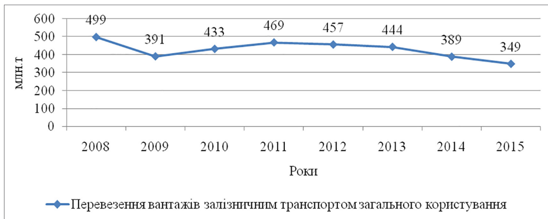
Рис. 1. Перевезення вантажів залізничним транспортом загального користування

Розподіл вантажоперевезень за типами задіяного транспорту в Україні кардинально відмінний від ЄС, де відсоток використання залізниці сягає лише 8%, автомобільних перевезень 44%, а здійснення перевезень морським або річковим транспортом