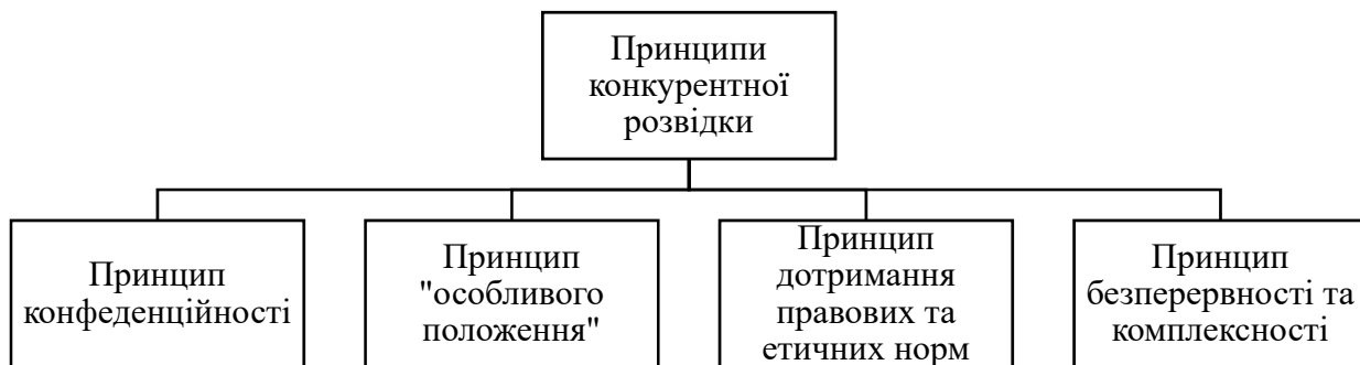
Рис. 1. Основні принципи конкурентної розвідки

Висновки. В цілому конкурентна розвідка — це елемент фінансово-економічної безпеки підприємства, сутність якої полягає в процесі пошуку, організації та аналізу зібраної інформації про внутрішнє й зовнішнє середовище компанії та надання вищій ланці керівників загальної інформації, що дає йому змогу побудови правильної стратегії та практики для своєчасного виявлення негативних чинників та їх нейтралізації для зменшення витрат в майбутньому періоді на виявлення і нейтралізацію загроз. Конкурентна розвідка збирає аналітичну інформацію для управлінських рішень в процесі діяльності підприємства. Сутність реалізації конкурентної розвідки