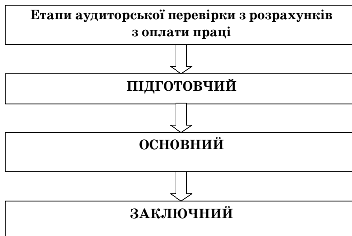
Рис. 2. Етапи аудиторської перевірки розрахунків з оплати праці

Для того, щоб сформулювати конкретну методику аудиторської перевірки з оплати праці, доцільно виділити наступні етапи (рис. 2).