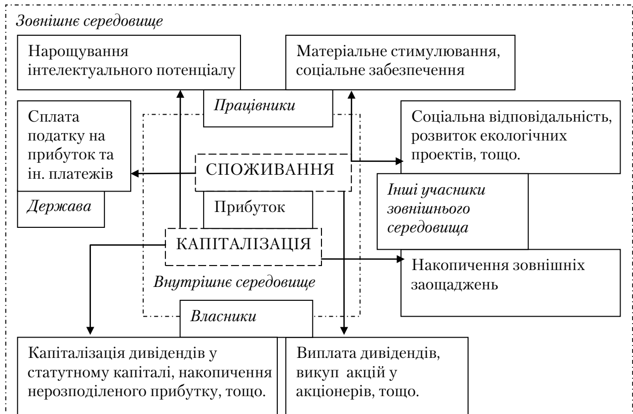
Рис. 3. Напрями удосконалення розподілу прибутку в умовах господарювання транспортних підприємств України* * розроблено авторами