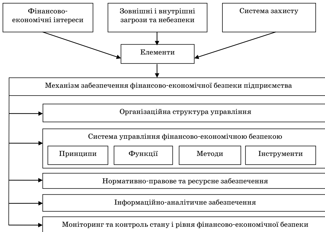
Рис. 2. Структурі механізму забезпечення фінансово-економічної безпеки підприємства (розроблено авторами на основі [7, ст. 208; 8, ст. 193])

Основні елементи механізму управління фінансово-економічною безпекою повинні визначатися із врахуванням фінансово-економічних інтересів підприємства та гарантувати стійку систему захисту. Так, Ліпкан В. Л. вважає, що механізм фінансової безпеки включає сукупність цілей, функцій,