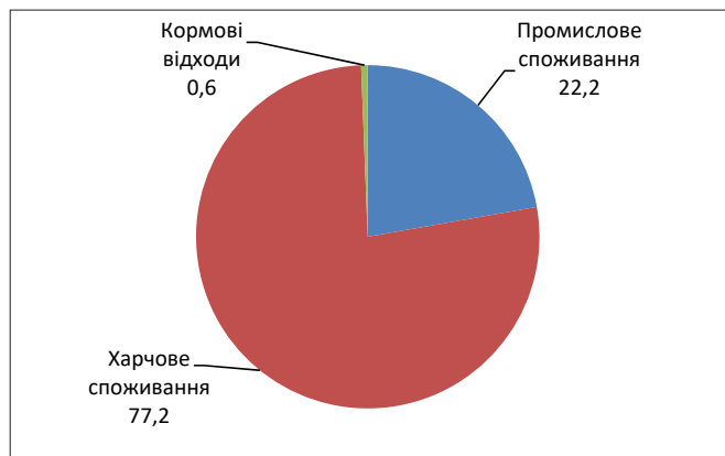
Рис. 2. Структура глобального споживання харчових рослинних олій (квітень 2017/2018 МР), %

Прогноз FAO відносно обсягів світового виробництва продукції олійних культур у 2017/18 МР у порівнянні з попередніми сезонами є достатньо помірним та базується на очікуваннях експертів щодо світового попиту на сировину. Фактичні дані, звичайно, можуть бути скориговані із потенційним зростанням доходів населення та підвищенням по-