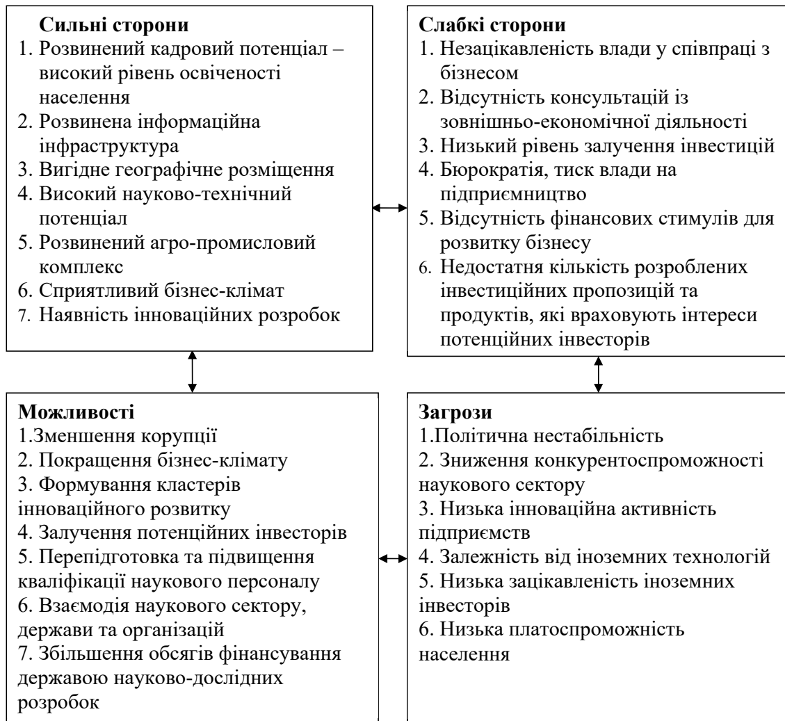
Рис. 2. SWOT-аналіз регіональної інноваційно-інвестиційної системи Полтавської області