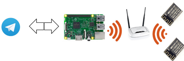
Рис. 1. Принцип роботи

Плата Raspberry Pi 3 і модулі ESP8266 підключенні до однієї точки доступу. До кожної ESP8266 підключений свій пристрій (наприклад RGBW стрічка), і вони запрограмовані на те щоб відправляти поточне значення свого стану і приймати при необхідності нове.