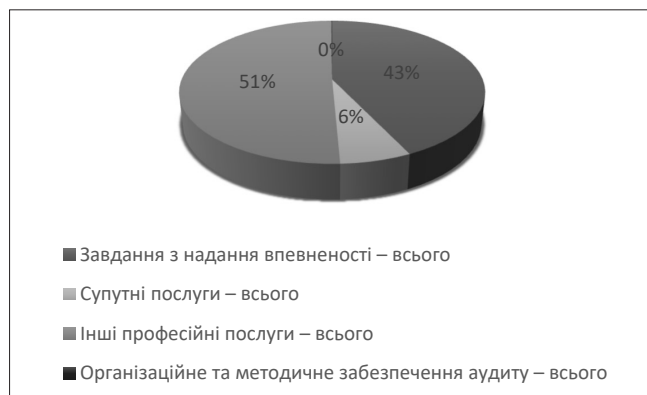
Рис. 3. Обсяг замовлень за видами послуг станом на 01.11.2017 р., %

Існує певна структура наданих аудиторських послуг станом на 01.11.2017 рр. (Рис. 3).