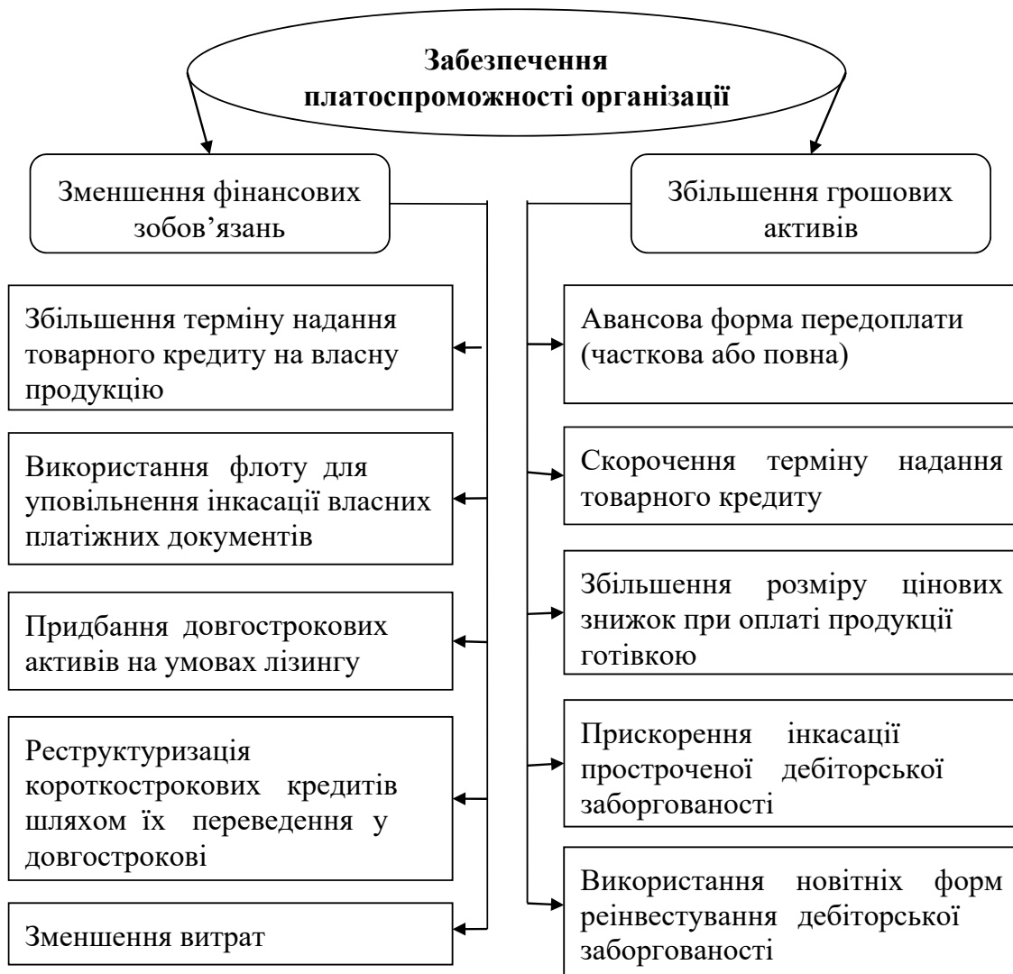
Рис. 2. Шляхи забезпечення платоспроможності організації

Висновки. Вітчизняні організації функціонують в мінливому економічному, політичному та