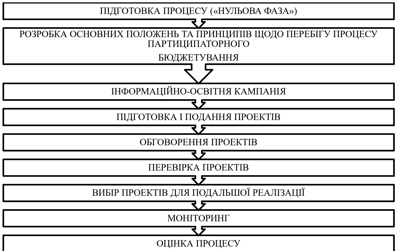
Схема 1. Етапи партисипаторного бюджету

відповідною довіреністю. Також практика функціонування бюджету участі в місті Миколаєві та його правова регламентація є досить цікавими в аспекті вимог до осіб, що можуть бути авторами проектів. Згідно з абзацом 4 розділу 4 Положення автор проекту — це особа, віком від 14 років, яка є громадянином України та проживає на території міста Миколаєва. В більшості інших міст обласного значення в Україні, де функціонує громадський бюджет, авторами можуть бути особи, що досягли 16 років. Загалом в аналітичній праці, присвяченій принципам організації партисипаторного бюджету в Польщі, відзначено, що нормативне закріплення подання проектів неповнолітніми є позитивним моментом, що потребує подальшого поширення серед держав, в яких запроваджуються громадські бюджети [5].