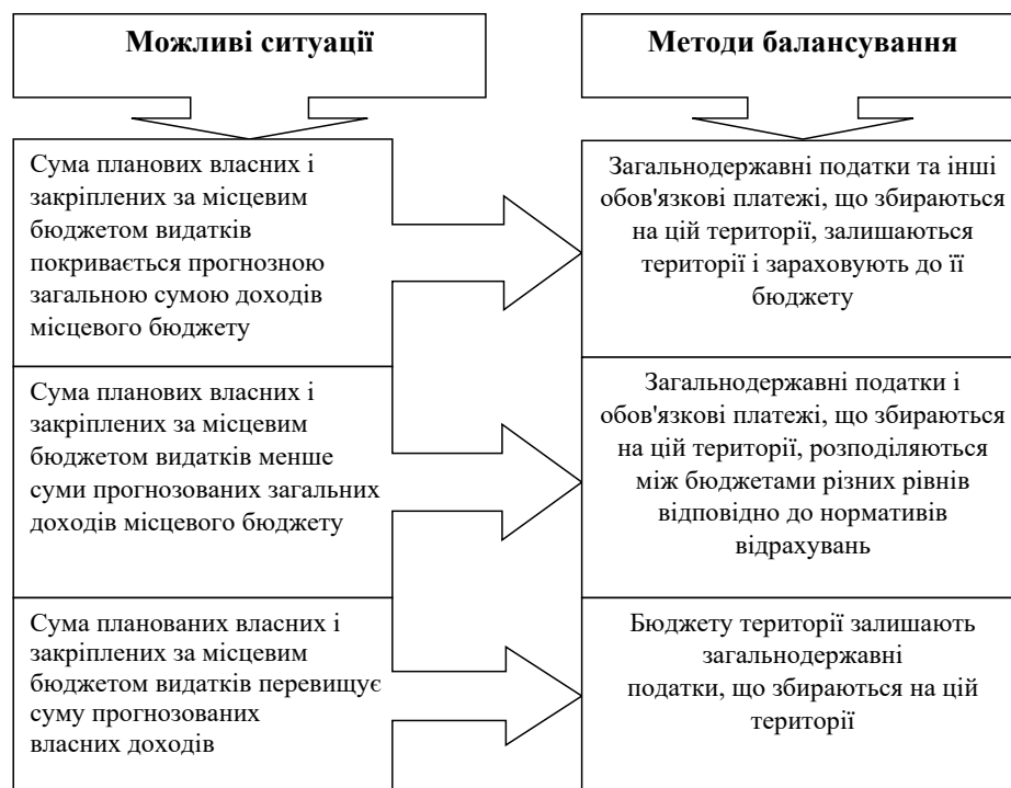
Рис. 2.13. Методи балансування місцевих бюджетів (варіант 2) [7]

бюджету нижчого рівня виділяється фінансова допомога у виді субвенцій і дотацій бюджетом вищого рівня. Субвенції мають строго цільове призначення, дотації носять безоплатний характер і надаються для покриття різниці між видатками і доходами місцевого бюджету. Для щоквартального і щомісячного балансування місцевих бюджетів також можуть надаватися бюджетні позики.