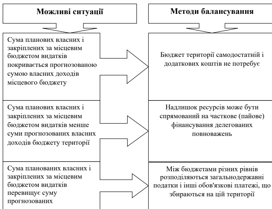
Рис. 2.12. Методи балансування місцевих бюджетів (варіант 1) [5]

Варіант 2. Можливі ситуації і методи балансування місцевих бюджетів за такими показниками: