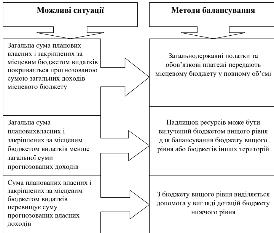
Рис. 2.14. Методи балансування місцевих бюджетів (варіант 3) [7]

Варіант 3. Можливі ситуації і методи балансування місцевих бюджетів за такими показниками: