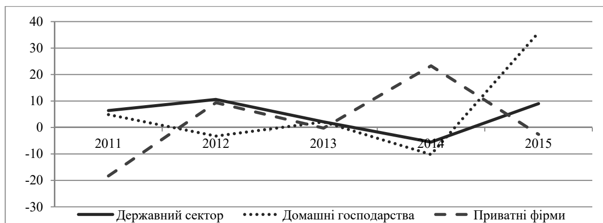
Рис. 3. Динаміка витрат на вищу освіту в розрізі джерел фінансування (2011–2015 рр., у% до минулого періоду) [розраховано і побудовано автором на основі [5]]

державних видатків, проте у 2013 р. і 2015 р. видатки недержавного сектору зростали швидше (коефіцієнт випередження становив відповідно 0,99 [1, с. 81] та 0,81), що свідчить про позитивні зрушення в напрямі диверсифікації джерел фінансування.