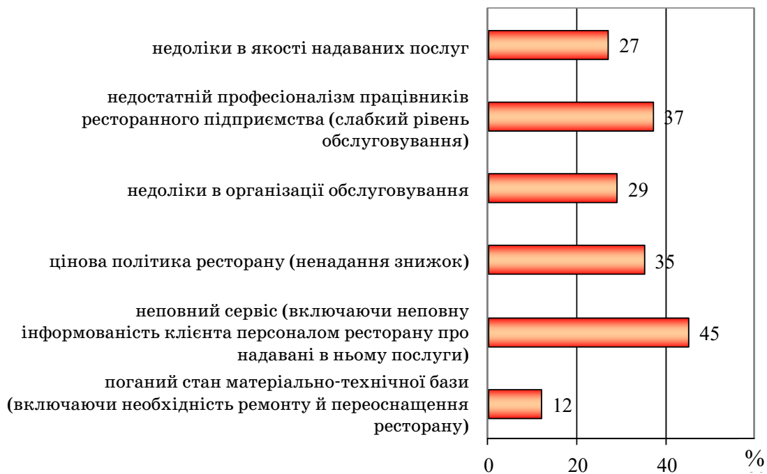
Рис. 1. Основні демотивуючі фактори відвідувачів ресторанів (авторська розробка)

У дослідженні було поставлене завдання визначення мотиваційного профілю персоналу ресторанних підприємств м. Харків. Респондентам про-