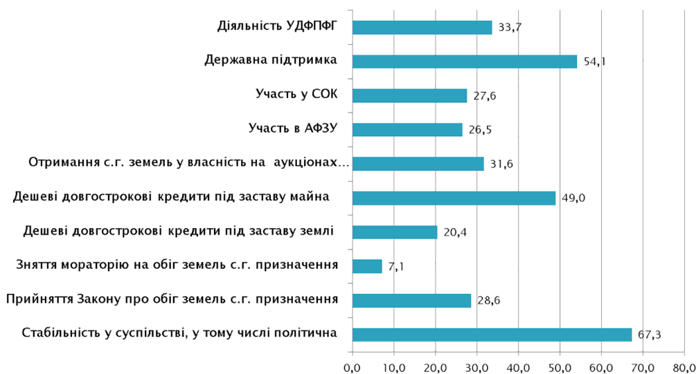
Рис. 1. Важливість зовнішніх чинників для ведення фермерського господарства

Примітка: респондент мав змогу вибрати декілька варіантів відповіді