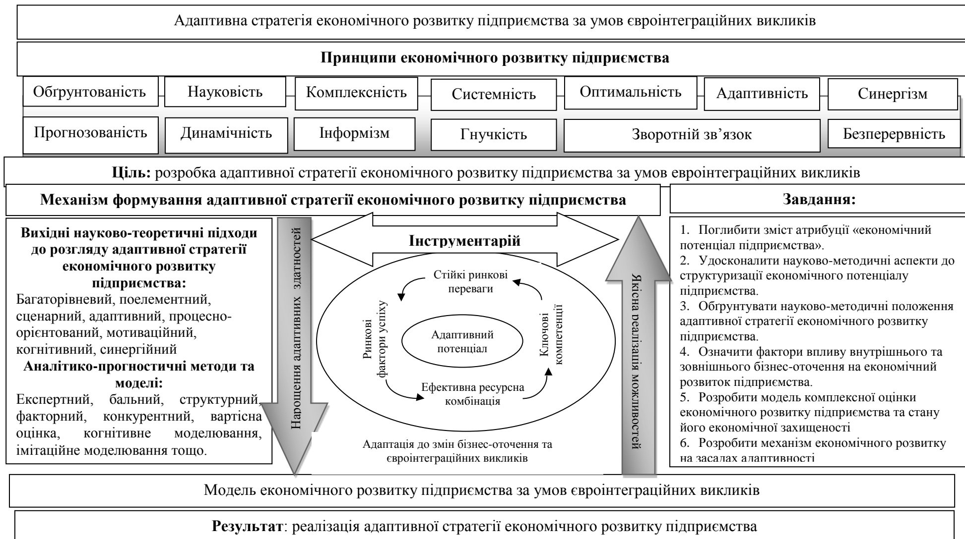
Рис.3. Алгоритм адаптивної стратегії економічного розвитку підприємства за умов євроінтеграційних викликів