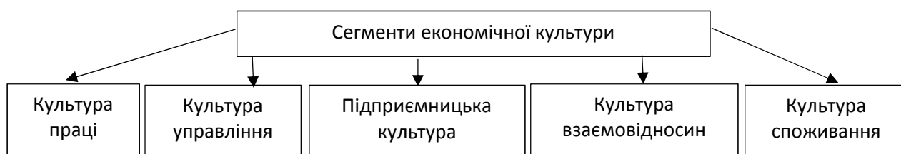
Рисунок 3 – Сегменти економічної культури

Сегменти економічної культури наведено на рис. 3..