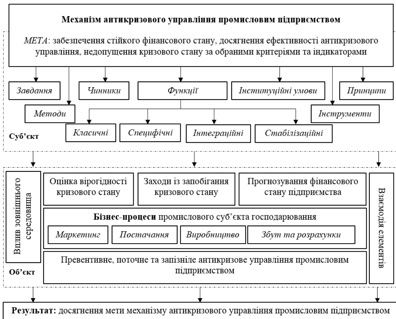
Рисунок 2 – Механізм антикризового управління промисловим підприємством