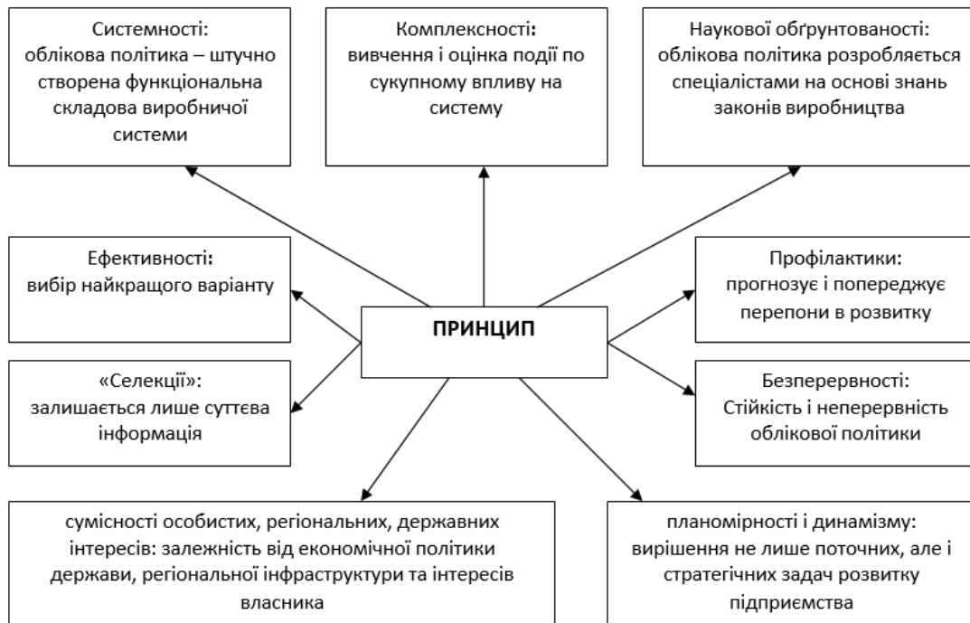
Рисунок 1 – Принципи формування облікової політики

На сьогодні облікова політика в повинна організації-управлінській, які впливають на вибір ґрунтуватися не лише на притаманних важливих факторів і характеризують зв'язки бухгалтерському обліку принципам, але й в внутрішньогосподарських процесів і зовнішнього обов'язковому порядку враховувати загальні середовища (рис. 1.).