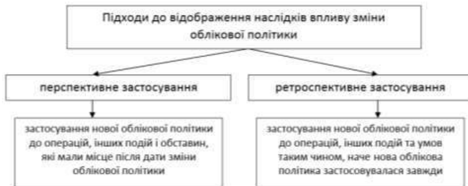
Рисунок 4 – Підходи до відображення зміни облікової політики відповідно до МСБО 8

Загалом, як у вітчизняній, так і міжнародній практиці бухгалтерського обліку виокремлюють два методи відображення наслідків зміни облікової політики (ретроспективний і перспективний) (рис. 4.).