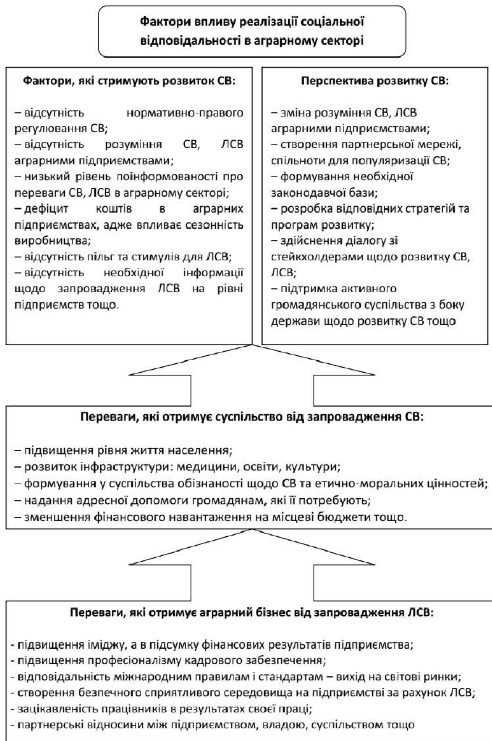
Рисунок – 2 Стримуючі фактори реалізації соціальної відповідальності та переваги від її запровадження в аграрному секторі

На основі проведених досліджень, нами охарактеризовано гальмуючі та стримуючі фактори реалізації соціальної відповідальності та переваги від її запровадження в аграрному секторі (рис. 2).