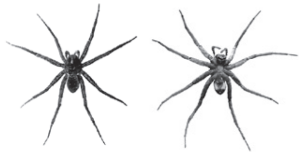
Рис. 2. Большой сплавной паук – Dolomedes plantarius (Clerck, 1758)

Крупный коричневый паук. Схож с D. fimbriatus Clerck, однако окрашен несколько иначе. Брюшко и головогрудь обычно без светлых полос, однако иногда узкие светло-желтые или беловатые полосы могут присутствовать. Более светлое ланцетовидное пятно на брюшке отсутствует или едва намечено, парные ряды белых точек обычно хорошо заметны. Ноги коричневые, как и брюшко (рисунок 2). Диагностические признаки: глаза расположены в два ряда, задние глаза значительно больше передних, брюшко вентрально с двумя желтоватыми продольными линиями. Эпигина без волосков; до 20 мм.