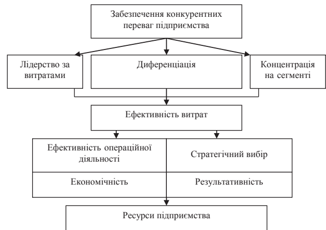
Рис. 2. Схематична модель системи забезпечення конкурентних переваг підприємства

З наведеної схеми можна стверджувати, що діяльність підприємства та його дії утворюють фундамент конкурентних переваг. Іншими словами, переваги чи недоліки підприємства визначаються всіма видами діяльності підприємства в цілому, а не окремими їх видами. Конкурентні переваги з'являються тоді, коли підприємство виконує необхідні дії з меншими витратами, аніж конкуренти, або виконує ці дії оригінальними способами, що створюють нецінову споживчу цінність.