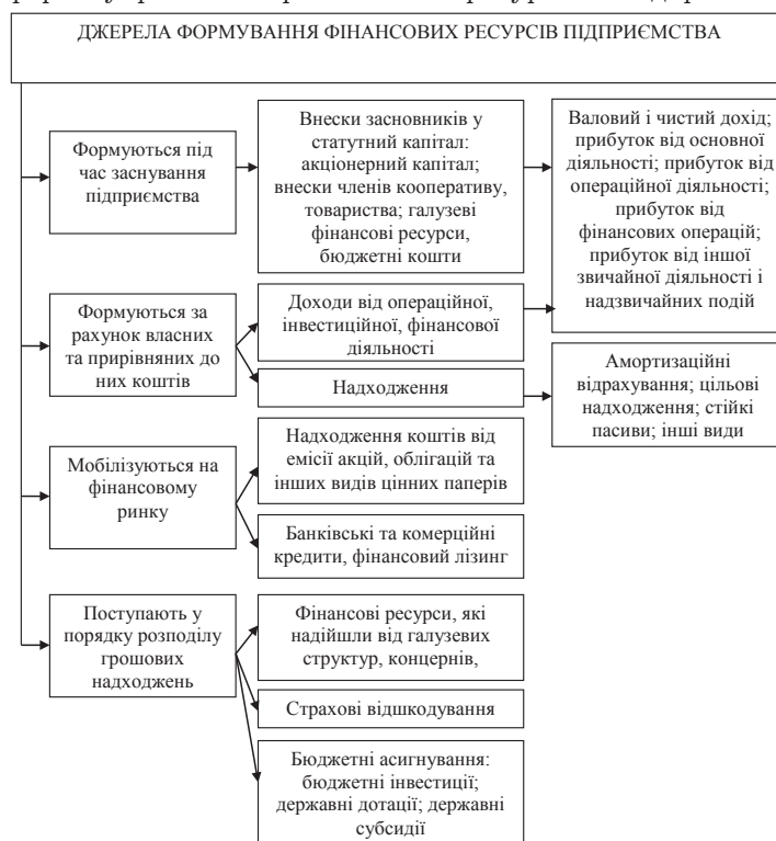
Рис. 1. Класифікація джерел формування фінансових ресурсів підприємства [3, с. 5]

Важливим напрямом підвищення ефективності діяльності підприємства є вдосконалення механізму управління фінансовими ресурсами діяльності. Головна спрямованість удосконалення механізму управління фінансовими ресурсами підприємств