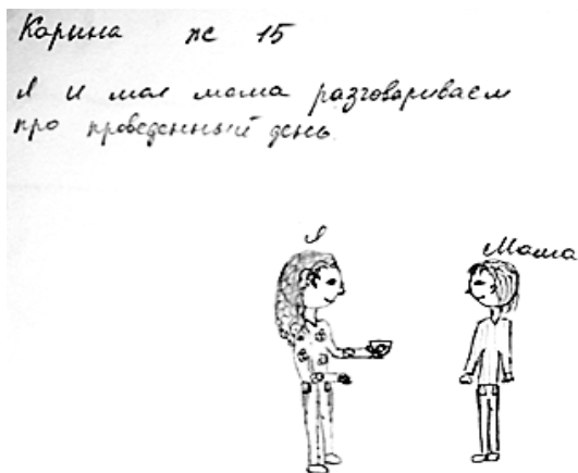
Рис. 4. Приклад малюнку досліджуваного

На всіх малюнках зображені люди, процес спілкування між людьми, є головний герой, який ідентифікований з самим автором малюнка. Це свідчить про те, що у процесі спілкування підліток можуть бути самими собою, проявляти свої почуття, бути повноцінними суб'єктами процесу спілкування. Також необхідно відмітити, що партнери по спілкуванню теж ідентифіковані, у них є ім'я чи пояснення, хто вони є. Це показник того, що навколишніх людей підлітки сприймають як партнерів по спілкуванню, особливо тих, з ким знайомі, певним чином взаємодіють. Процес спілкування з цими людьми не блокований.