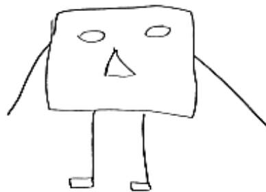
Рис. 2. Приклад малюнку досліджуваного