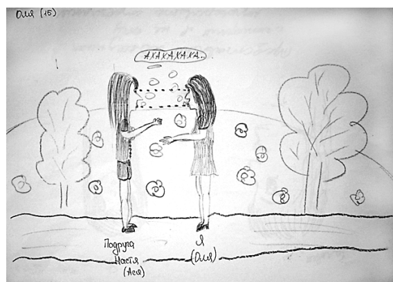
Рис. 5. Приклад малюнку досліджуваного

Процес спілкування, що зображений підлітками, які живуть в родині, достатньо емоційний, невимушений, більш яскравий. Підлітки не бояться проявляти себе у спілкуванні, пізнавати щось цікаве та дізнаватись щось нове про партнера по спілкуванню (див. рис. 5). Проте також необхідно сказати, що така місцями надмірна емоційність може спричинювати відчуття підлітком певної некомпетентності у процесі спілкування, що також проявляється на малюнках досліджуваних.