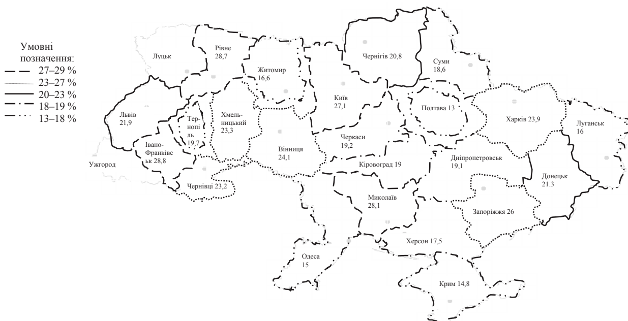
Рис. 2. Інноваційно активні підприємства у 2011–2013 рр., %

Щодо напрямів інноваційної діяльності підприємств України, то понад три чверті підприємств з технологічними інноваціями придбали машини, обладнання та програмне забезпечення для виробництва нових або значно поліпшених продуктів та послуг. Досить вагома частка підприємств виконували науково-дослідні роботи (НДР), проводили навчання та підготовку персоналу для розроблення і/або впровадження ними нових або значно удосконалених продуктів і процесів, здійснювали ринкове запровадження інноваційних продуктів та послуг, включаючи ринкове дослідження і проведення рекламної кампанії, здійснювали процедури та технічну підготовку до запровадження нових або значно удосконалених продуктів і процесів, які ще жодного разу не були представлені [4, с. 115]. При цьому, укладанням договорів про придбання результатів виконання НДР у інших компаній (включаючи підприємства їхньої групи підприємств), державних або приватних науково – дослідних організацій, та придбанням інших зовнішніх знань (придбання або ліцензування патентів і не патентованих винаходів, ноу-хау та інших типів знань у інших організацій) займалось кожне десяте підприємство з технологічними інноваціями.