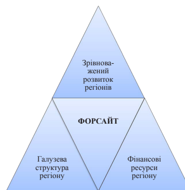
Рис. 2. Узагальнені вихідні дані для форсайту аграрних підприємств*

Звичайно, при використанні форсайту повинні бути враховані регіональні аспекти. Беручи за основу зрівноважений розвиток регіонів й враховуючи похибки на галузеву структуру певного регіону можна буде використовувати форсайт, як вихідну площадку для дослідження майбутнього всіма суб'єктами господарювання й політики (рис. 2).