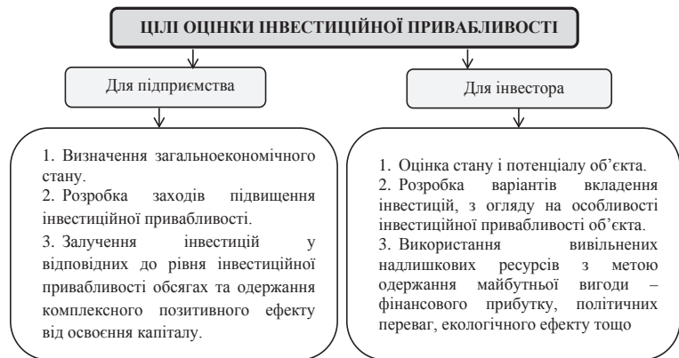
Рис. 1. Цілі оцінки інвестиційної привабливості залежно від замовника її дослідження [10, с. 174]

З огляду на велику кількість тлумачень поняття ІПП не існує й єдиної відповіді на питання, які саме фактори впливають на її рівень. Кожен автор виділяє різноманітні фактори. Наприклад, Є.А. Якименко [20] виділяє такі фактори, як фінансовий стан, привабливість продукції, знос основних фондів, якість персоналу. В.С. Яковлев відокремлює політичні, правові, економічні та соціальні фактори. Т.В. Майорова [12] виділяє найважливіші наступні п'ять факторів, зокрема: сфера діяльності, можливості виходу на зовнішній ринок, фінансовий стан, відносини з владою, місце розташування підприємства.