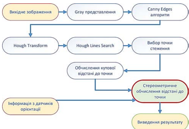
Рис. 2. Схема обробки даних

Таким чином, отримується система розпізнавання перешкод та засоби визначення відстані до неї, за умови, що поверхня, над якою знаходиться камера та перешкода є достатньо рівною [2].