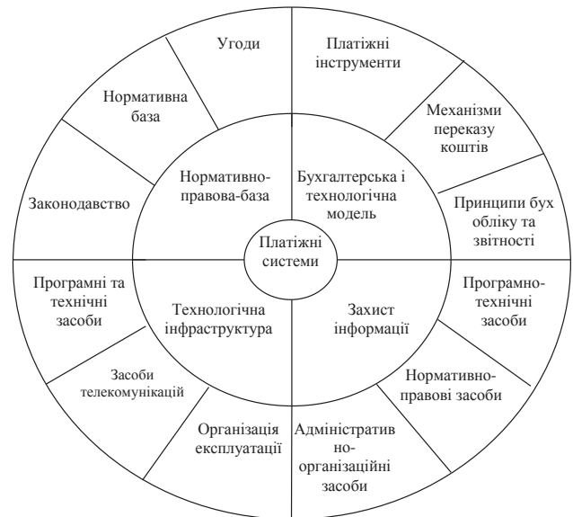
Рис. 2. Основні елементи платіжних систем

Відмінність ознак, характерних для окремих країн (розмір, обставини історичного розвитку, правова система, ділова практика, комунікаційна система, інфраструктура, ступінь розвитку закладів та їх інструментів тощо), роблять національну платіжну систему унікальною. Однак існує низка елементів, життєво необхідних для кожної ефективної системи платежів (рис. 2).