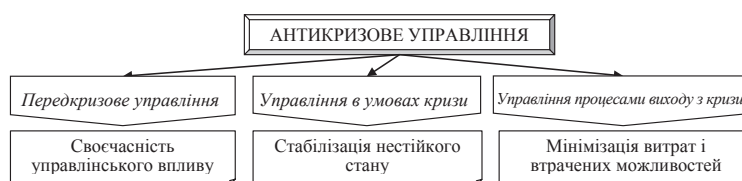
Рис. 1.1. Підходи до розуміння поняття «антикризове управління» [узагальнено на основі 4, 5, 7, 10, 11]

Суб'єктами антикризового управління підприємством як керуючої підсистеми є: власник підприємства, економіст-фінансист (фінансовий директор), функціональний антикризовий менеджер – співробітник підприємства, функціональний антикризовий менеджер – співробітник консалтингового підприємства, представник са-