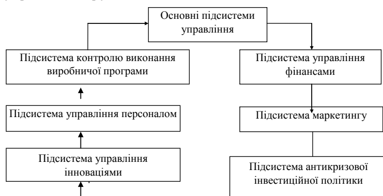
Рис. 1.3. Основні підсистеми управління, які задіяні у системі антикризового управління підприємством

Підсистема управління фінансами відіграє ключову роль оскільки включає відповіді за реалізацію наступних завдань: формування ефективних інформаційних систем, що забезпечують обґрунтування альтернативних варіантів управлінських рішень; здійснення ефективного контролю за реалізацією управлінських рішень щодо фінансового оздоровлення підприємства; здійснення аналізу фінансового стану і результатів фінансової діяльності підприємства; розробка дієвої системи стимулювання реалізації ухвалених управлінських рішень щодо фінансового оздоровлення підприємства; здійснення планування фінансового оздоровлення підприємства; діагностика кризових симптомів розвитку підприємства; від-