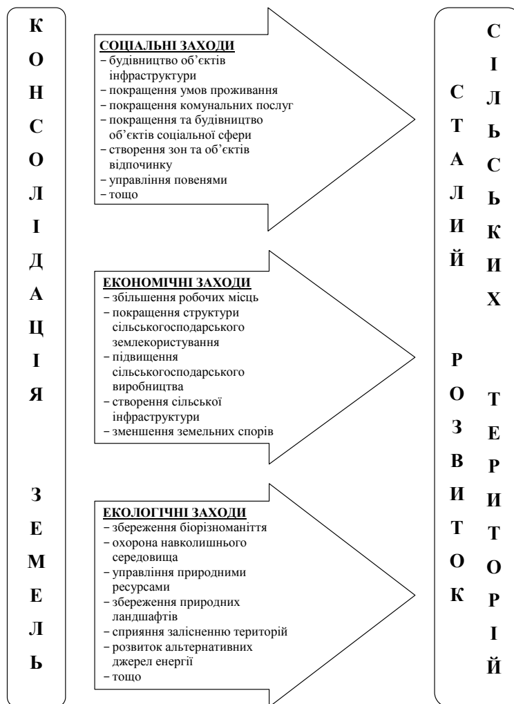
Рис. 1. Консолідація земель як інструмент сталого розвитку сільських територій

На основі проведеного дослідження наукової літератури закордонних авторів і залежно від цілей проекту консолідація земель може бути розділена на п'ять типів чи категорій: сільськогосподарського (сільського), лісгосподарського, міського, регіонального та екологічного призначень . Окремі типи консолідації можуть бути об'єднані в один загальний проект. Необхідно зазначити, що консолідація земель сільськогосподарського призначення (сільськогосподарських земель) відноситься як до традиційної, так і сучасної форми консолідації земель детальна характеристика якої нами вже наводилася у попередніх працях.