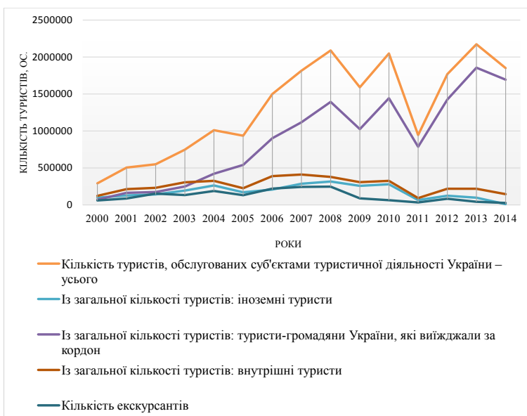
Рис. 1. Динаміка туристичних потоків

Розвиток міжнародного туризму в країнах, переважно приймають туристів, обумовлено прагненням збільшити приплив іноземної валюти і створити нові робочі місця. Багато країн за допомогою міжнародного туризму намагаються вирішити проблеми платіжного балансу. Співвідношення між доходами і витратами від міжнародного туризму в країнах та регіонах відрізняється. Найбільше по-