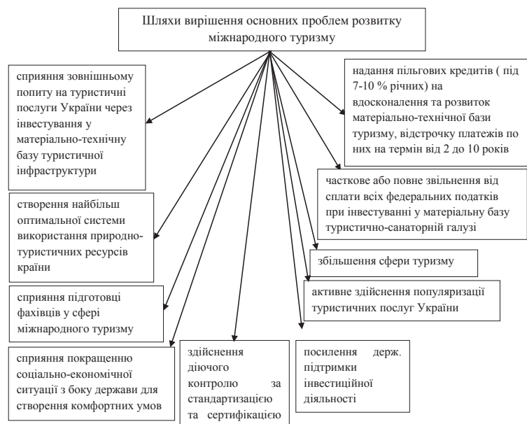
Рис. 3. Шляхи вирішення основних проблем розвитку міжнародного туризму

Висновки і перспективи подальших досліджень. Зважаючи на вищесказане, міжнародний туризм є вагомим рушієм зростання економіки, збільшення частки виробництва, працевлаштування та міжнародних трансакцій. Аналізуючи розвиток міжнародного туризму за останні роки, необхідно зазначити, що туризм перетворився в перспективну галузь міжнародного бізнесу з багатьма напрямками свого розвитку, індустрією курортів, особливими фінансовими інструментами,