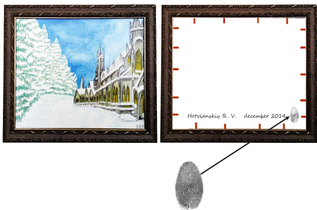
Рис. 4. Відбиток пальця (на звороті)