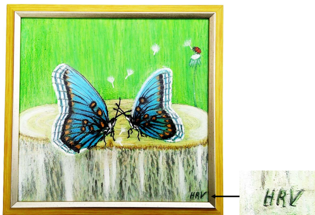
Рис. 1. Звичайний алгоритм захисту образотворчого твору

Перед тим як розглянути спеціальні алгоритми захисту під час створення твору, на самперед, розберемось із звичайними алгоритмами, які користуються популярністю в сьогоденні, а саме – підписи та дата.