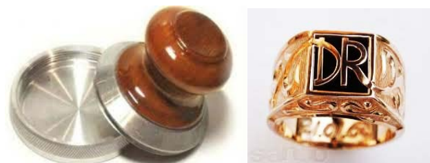
Рис. 3. Печатка (факсиміле)