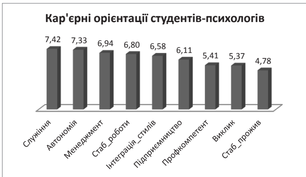
Рис. 3. Уподобання кар'єрних орієнтацій студентів-психологів

Результати, отримані за методикою діагностики кар'єрних орієнтацій, показують, що «Служіння» та «Автономія» є провідними кар'єрними орієнтаціями в цілому по вибірці студентів-психологів, на останньому місці – «Стабільність проживання» (рис. 3).