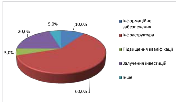
Рис. 3. Бажаний середній розподіл фінансування регіональних цільових програм, за думкою автора.

Найголовнішим завданням на сучасному етапі у розвитку туристичної галузі в Україні є налагодження та створення необхідної інфраструктури. Це можливо тільки за рахунок залучення інвестиційних коштів, як державних, так і приватних. Приведемо бажаний середній розподіл фінансування регіональних цільових програм, за думкою автора.