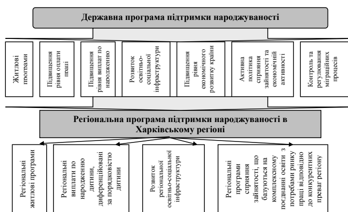
Рис. 2. Напрямки регіональної програми підтримки народжуваності в Харківському регіоні

Висновки і пропозиції. Регіональна програми підтримки народжуваності в Харківській області повинна базуватися на державних програмах і розроблятися на основі впливу визначених факторів, які об'єднані в регресійній моделі. Перспективними напрямками повинні стати: