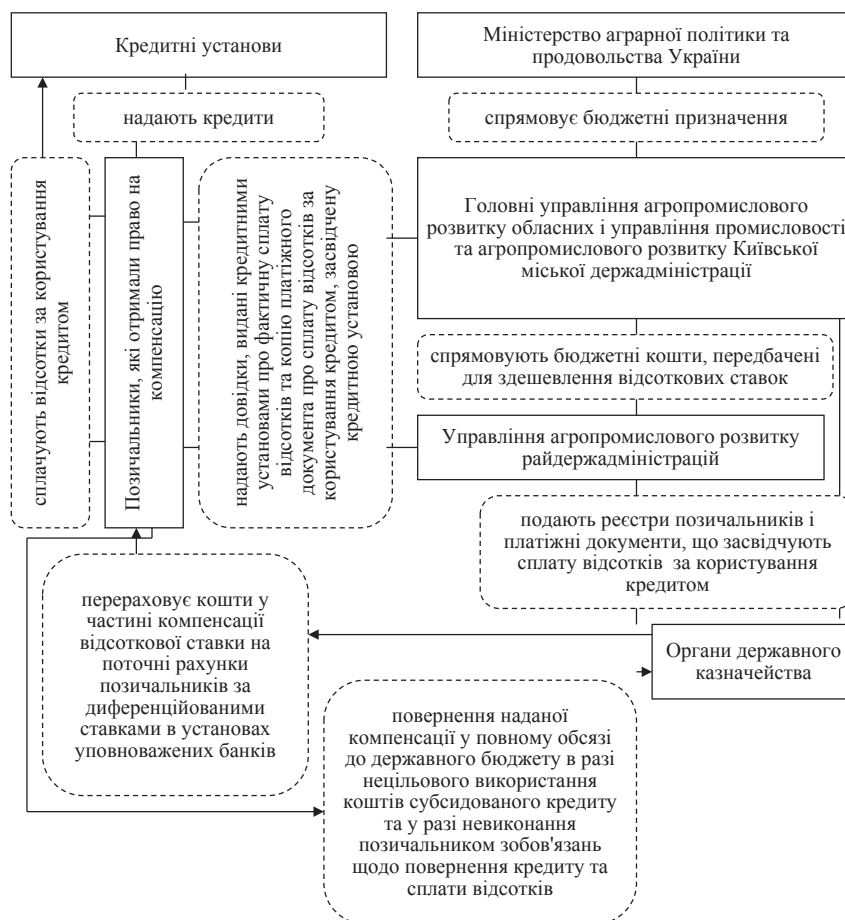
Рис. 2. Механізм державної підтримки сільськогосподарських підприємств через здешевлення відсоткових ставок за кредитами

Висновки і пропозиції. В умовах інтеграції України до європейського економічного простору, глобалізації світової економіки актуальними питаннями у сфері державного регулювання аграрного сектору є питання підвищення ефективності державної підтримки. Сучасна політика підтримки аграрного сектору економіки України характеризується хаотичністю, неоднорідністю структури, постійною зміною векторів та відсутністю стійкої тенденції до зростання. Державне регулювання та