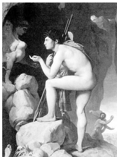
Рис. 3. Картина Ж. Энгра «Эдип и Сфинкс», ок. 1827. Париж, Лувр

эдипальных зависимостей субъекта на структурирование психики и возможности познания последней с использованием художественных полотен в качестве стимульного символического материала в диагностико-коррекционном процессе. З. Фрейд, утверждая влияние эдипового комплекса на дальнейшую жизнь субъекта, акцентировал внимание на роли запрета проявления либидных чувств к родителям, что противоречит природным влечениям ребенка. Нереализованная энергия либидо вытесняется из сферы сознательного, что и становится решающим фактором в формировании комплекса.