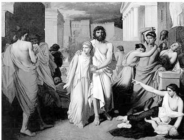
Рис. 2. Картина Жалабера «Антигона выводит слепого Эдипа из Фив», XIX в.

динамической теории эдипов комплекс это бессознательное образование, неосознаваемое субъектом, которое формируется на латентном уровне в период до 6-7 лет и связан с вытеснениями. В основе вытеснений лежат травматические переживания детства, порожденные неудовлетворением потребностей ребенка и связанные с амбивалентными чувствами субъекта к родителям (воспитателям) в период раннего детского развития. Табуированная информация перекодируется на язык символов для неузнаваемости и возможности беспрепятственного проявления в поведении, что связано с психологическими защитами. В основе диагностико-коррекционного процесса, согласно психодинамической теории (Т. С. Яценко), лежит механизм частичной многоуровневой положительной дезинтеграции (обеспечивается введением групповых правил, способствующих нивелированию проявлению периферийных (ситуативных) и изучению базальных (глубинных) психологических защит) и частичной многоуровневой вторичной интеграции психики на более высоком уровне. Глубинное познание связано с эдиповым комплексом и базальными (глубинными) психологическими защитами, исследование последних базируется на выявлении искривлений социально-перцептивной реальности и ослаблении их ошибочной когнитивной основы, что открывает перспективы дальнейшей интеграции психики на более высоком уровне и самокоррекции.