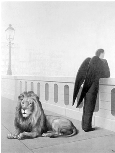
Рис. 5. Картина Рене Магритт «Ностальгия»

П.: 69. Тогда есть опасность, что в вашей диаде будет лев и кот. Как бы и порода одна, понимание, но это как ваш крест, это будет заполнять дырки (камешки, которые респондент выбрал как качество, интроецированное от отца), те чувства, которые вынесены из семьи. Трудно будет воспринимать это, но это реалии.