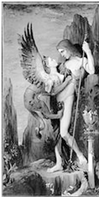
Рис. 1. Картина Гюстава Моро «Эдип и Сфинкс»

Согласно древнегреческому мифу, главный герой Эдип убивает своего отца и женится на матери Иокасте по неведению. Ранее его родители были напуганы предсказанием оракула о том, что их сын убьет отца и женится на матери, тогда они решили избавиться от своего наследника. Однако исполнитель приказа пожалел младенца и передал его пастуху из Коринфа, и ребенок впоследствии был усыновлен коринфским царем Полибом. Узнав о предсказании, уже повзрослевший Эдип решает покинуть своих приемных родителей, чтобы избежать страшного пророчества. У города Фивы, откуда был родом Эдип, на него чуть не наехала колесница, всадники которой стали бранить и бить юношу. В драке Эдип убивает сидевшего в колеснице старика и еще троих спутников. Стариком оказался отец Эдипа, о чем он не знал. Эдип становится правителем Фив и берет в жены вдову погибшего царя Лая Иокасту. Спустя пятнадцать лет на город обрушивается эпидемия чумы. Жители Фив, дабы найти причину несчастья, обращаются к оракулу, который говорит о том, что необходимо найти убийцу царя Лая и изгнать его. Эдип узнает страшную истину о том, что его отец – царь Лай, а мать – супруга Иокаста, которая, не выдержав позора, убивает себя. Эдип выкалывает себе глаза и покидает Фивы, а его дочь Антигона вызывается сопровождать своего отца [13].