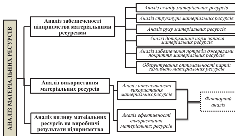
Рис. 1. Основні напрями аналізу виробничих запасів запропоновані Тринькою Л.Я. та Липчанською (Іванчук) О.В.

Болюх М.А., Бурчевський В.З., Горбатов М.І., Чумаченко М.Г. [5, с. 405-406] також виділяють три етапи аналізу запасів: аналіз обґрунтованості та ефективності формування портфеля договорів на поставку матеріальних ресурсів; аналіз ефективного