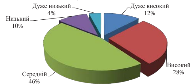
Рис. 2. Рівень розвитку креативності підлітків за методикою Д. Джонсона (у %)

літкового віку дозволить їм ефективніше долати складні життєві ситуації на її основі.